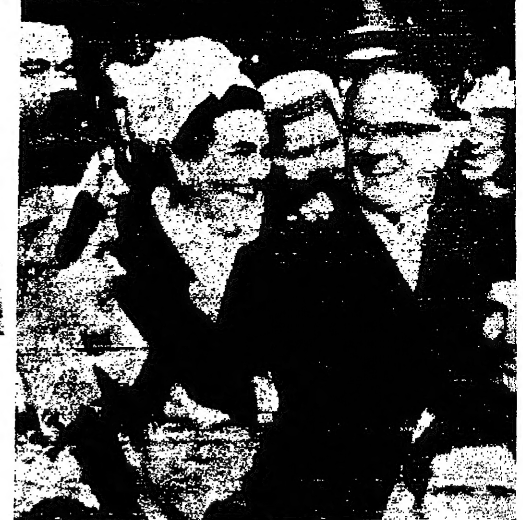
شبان مقلدة البوسنة في يوغوسلافيا يهتفون بالفرنسيين خلال زيارته هيتلر جاكوبي التاريخي لبلدية المندوب الوطني

واشنطن - رويتر - قالت الوكالات المتحدة انها رفضت احتجاجاً سوفيائياً على إنشاء قيادة استطلاع جوي تابعة لحلف شمال الأطلسي تقوم بالبرقعة في البحر الأبيض المتوسط.